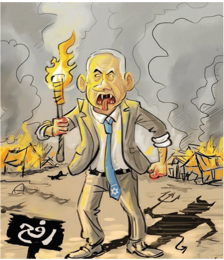
جنون شیطانی اسرائیل در رفح