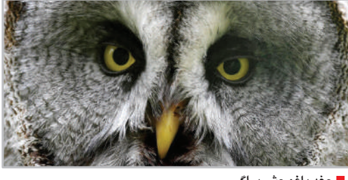
جغد باغ وحش پراگ