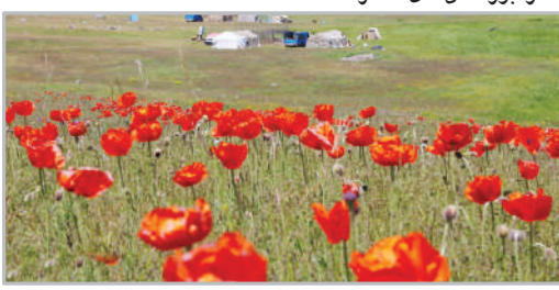
شقایق‌های دل‌انگیز «فروداغ»