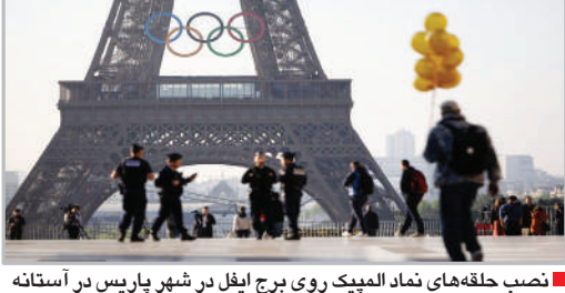
نصب حلقه‌های نماد المپیک روی برج ایفل در شهر پاریس در آستانه برگزاری المپیک تابستانی ۲۰۲۴