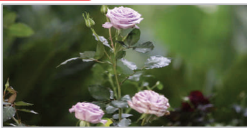
نمایشگاه گل و گیاه - کیش